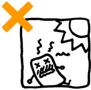
直射日光や高温の 所に置かない