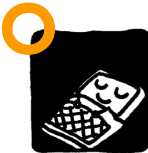
すずしく、暗い所で 保管してください

リライトカード(利用券)は とてもデリケートなカードで す。保管を誤ると、カードの 文字が印字されにくくなつた り、消えにくくなつたり、専 用の機械が反応しなくなつた りします。注意して保管しま しょう。