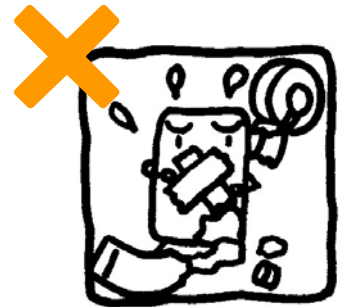
のりやテープをはらない